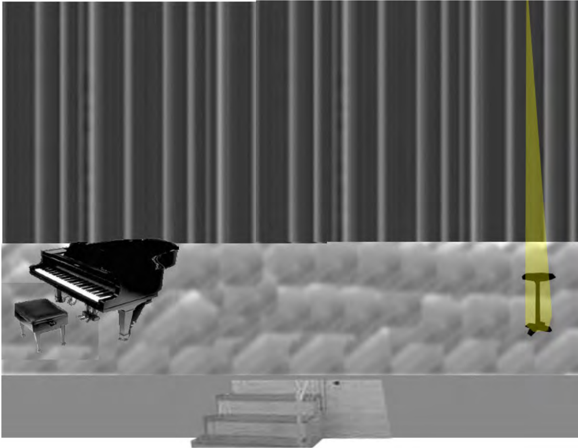
Abbildung 7 a („finger“ und Auftrittslight 2. teil)

zweiter Teil: der "Finger von oben" (Tischchen wird gestellt)